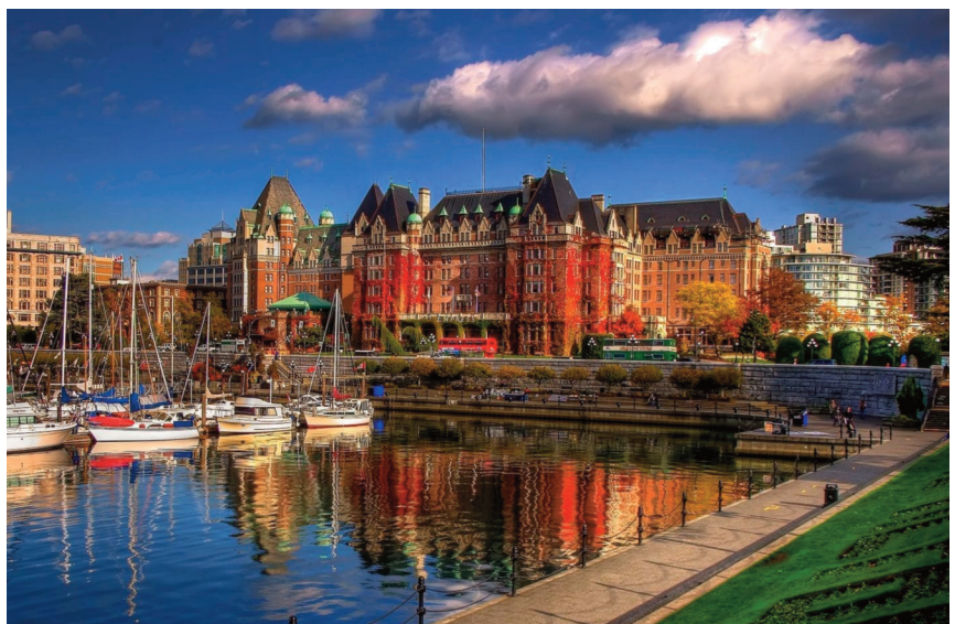
L'hôtel Empress et la havre de Victoria