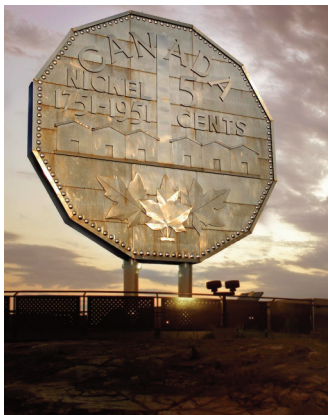
Le Big Nickel de Sudbury