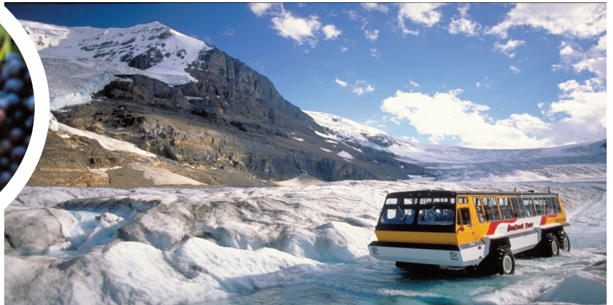
La route du Champ de glace, excursion en véhicule tout terrain sur le glacier Athabasca