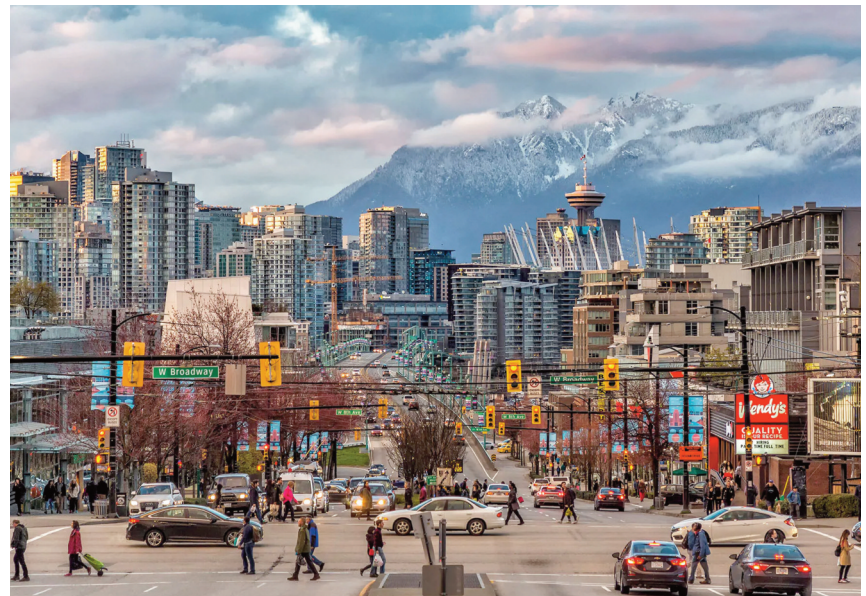
Vancouver ! Une ville moderne, dynamique où l'environnement courtise l'urbanité !