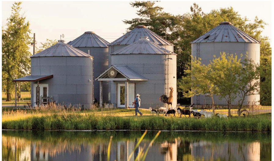
La traversée des prairies aux horizons sans fin.

La traversée des prairies aux horizons sans fin. (Fairfield Inn & Suites) PD