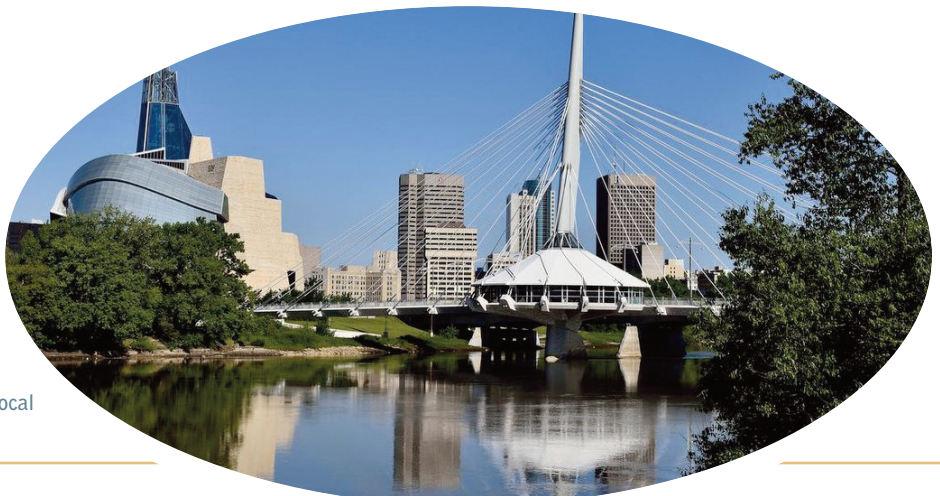
Tour de ville de Winnipeg avec guide local