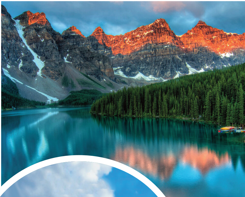
Quelques uns des joyaux de l'ouest canadien : le parc national de Yoho, les rocheuses et le vignoble de Osoyoos