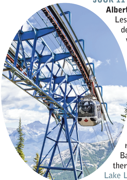
L'ascension du mont Sulphur en télécabine

Ascension du mont Sulphur en téléphérique, tour de Banff et sa région, le dîner à l'hôtel Fairmont Banff Spring, baignade dans les eaux thermales. (Mountaineer Lodge Village Lake Louise) PD-D