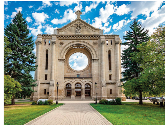
La cathédrale de Saint-Boniface