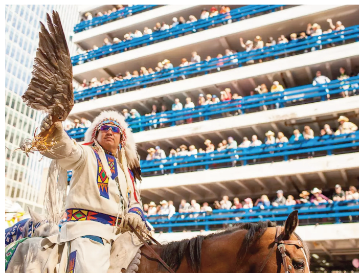
Depuis 1912, le Stampede est la fierté de tous les Canadiens. Divertissement assuré !