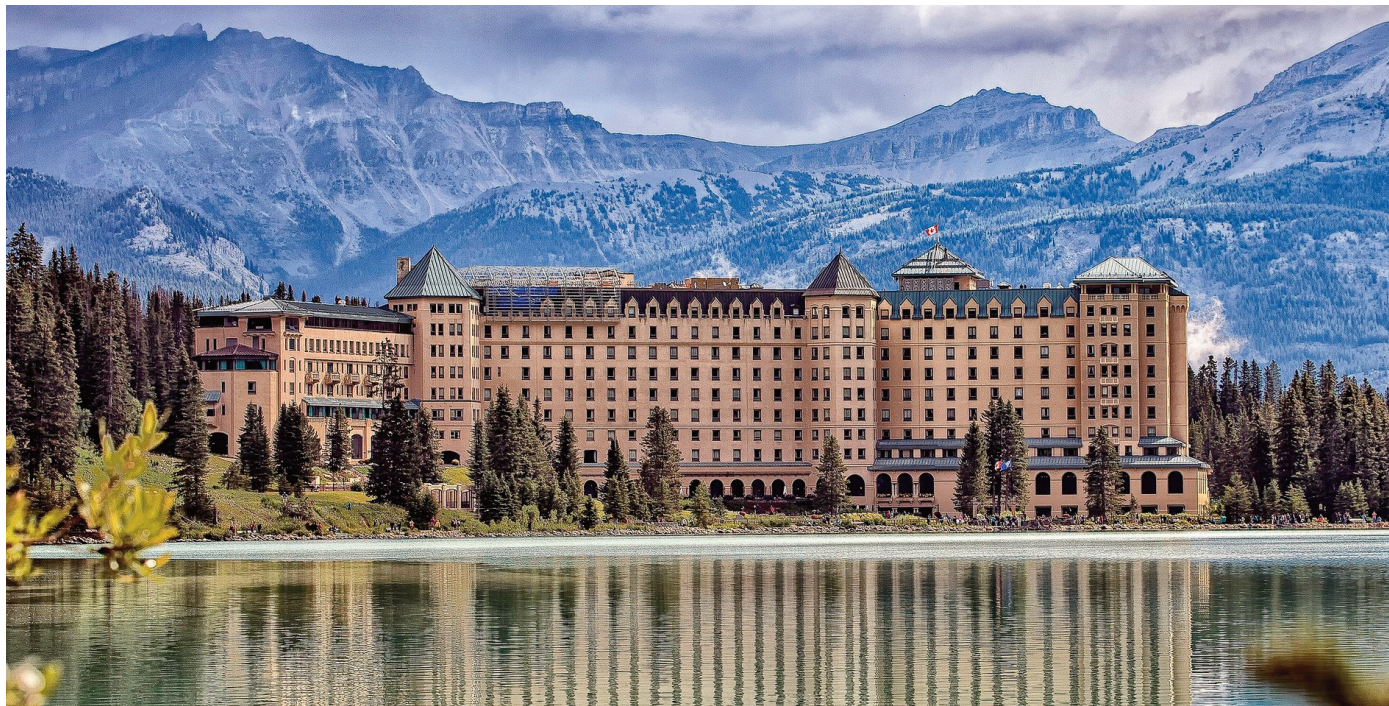
Le Fairmont Château Lac Louise, le roi du domaine

11 jours, circuit dans l'ouest canadien de Calgary à Victoria