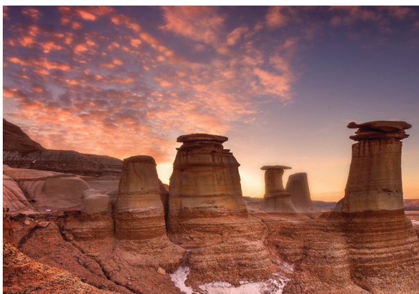
La région désertique de Drumheller au pays des dinosaures